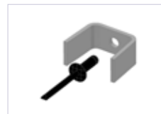
Manchon acier à riveter